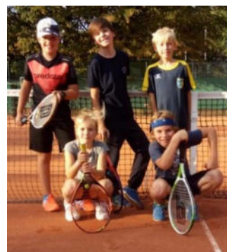
gemischte Bambini Mannschaft 2019