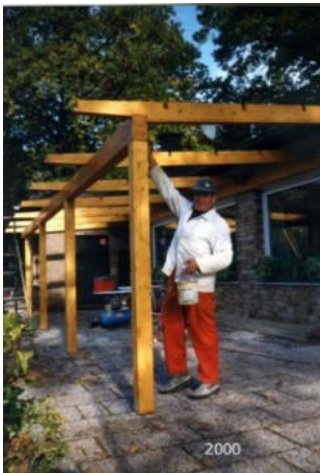
Bau der Terrassenüberdachung. Wie schon lange Tradition, wird selber Hand angelegt.