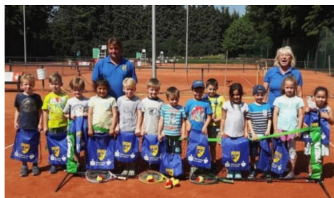
Kinder der KiTa Kranichstraße nach dem Schnuppertraining. Über den neuen Turnbeutel als kleines Geschenk freuten sich die Kids besonders.

Kinder sind nicht nur ein Segen und der Motor in jeder Familie, sondern auch in jedem Verein. Sie zu erreichen ist in unseren Zeiten ist eine Herausforderung, da es so viele Beschäftigungsmöglichkeiten, Medien und Reize gibt. Letztlich gelingt es nur in ganz jungen Jahren und über die Eltern.