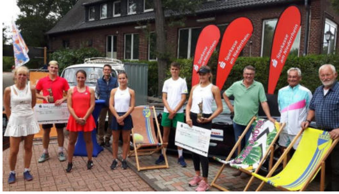
Endspielteilnehmer nach der Siegerehrung

Vom 28. bis 30. August richten wir zum vierten Mal die Sparkasse am Niederrhein Open - trotz der Corona Krise - als deutsches Ranglistenturnier aus. Über siebzig Teilnehmerinnen und Teilnehmer sind Rekord und bescheren wieder in den offenen Klassen Spitzentennis. Die Siegerin kam aus Pforzheim, der Sieger aus Mannheim. Die weiteste Anreise hatte eine 13-jährige Teilnehmerin aus Itzehoe.