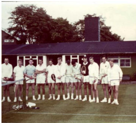
Nottingham, Tennisclub „West Bridgeford“

Reise zum Freundschaftsturnier in Nottingham/England . Erstmals Tennis auf Rasen!