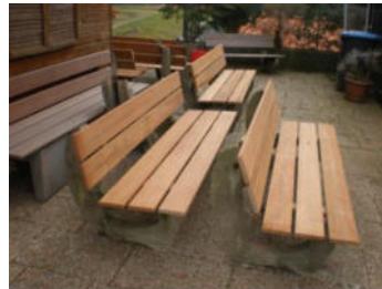
von Jürgen Förderer wurden neue Bänke angefertigt.

Aufstieg: Herren 40 steigen von der BK B in die BK A und die Herren 55 von der BK D in die BK C auf.