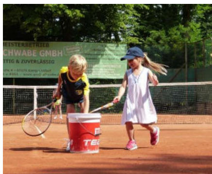
unsere sportliche Zukunft

Wir subventionieren das Jugendtraining und setzen auf Kontinuität beim Trainer. Es bleibt bei der Annahme: Sport ist einer der positiven Sozialisationsfaktoren und fördert eine gesunde Entwicklung.