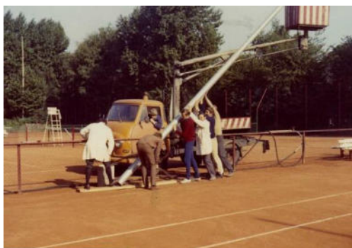
Die Plätze 1 und 2 erhalten eine Flutlichtanlage , die von dem Elektrounternehmer und späterem Mitglied Erwin Schmitz gespendet wurde. Der Aufbau erfolgt durch die Mitglieder unter Anleitung von Ewald Schliemann.