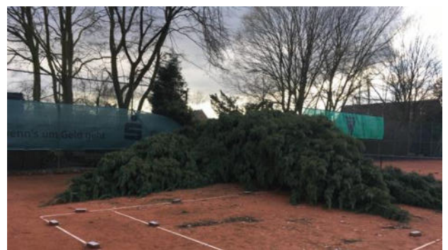
Blick auf Platz 1

Im Frühjahr wird in China ein bisher unbekanntes Virus entdeckt und sorgt für starke Quarantäne Maßnahmen in China. Die Welt schaut noch scheinbar unbeteiligt zu.